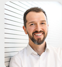
Andreas Gaida Veranstaltungsmanagement